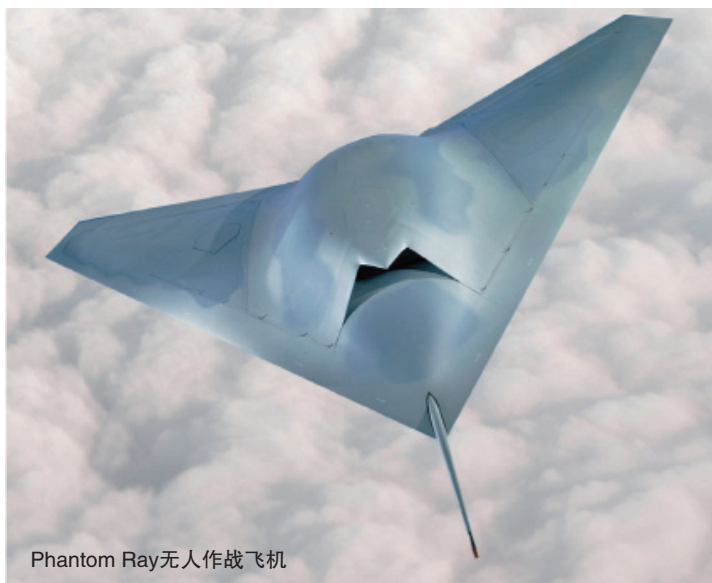
Phantom Ray 无人作战飞机

(1) “控制技术”成为美军 2030 年前最优先发展的关键技术, 将大大促进无人机系统自主能力的提升。